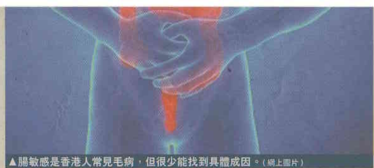
▲腸敏感是香港人常見毛病，但很少能找到具體成因。(網上圖片)

(2) 若懷疑自己並非單純腸敏感，最好看一次醫生。「因為肚瀉、便秘、肚痛這幾個症狀，固然可能是因為腸敏感，但也可以是其他腸病的症狀，例如克隆氏症，甚至腸癌也常見會有這些症狀。當然，腸癌一般還可能有其他症狀，如體重驟跌、胃口轉差、大便有血，甚至摸到腹部有腫塊等，但早期的腸癌這些症狀並不明顯，市民不易清楚分辨。尤其腸癌已成為本港頭號癌症，且有年輕化趨勢，有懷疑更應盡快檢查。」蕭醫生說。