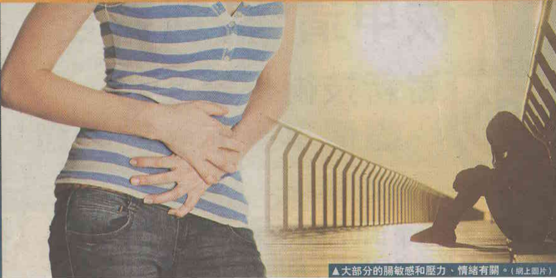
▲大部分的腸敏感和壓力、情緒有關。(網上圖片)