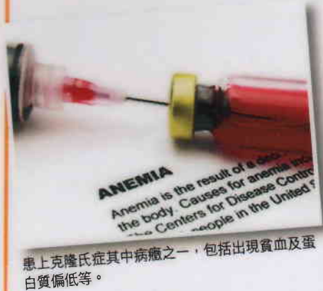
患上克隆氏症其中病癥之一，包括出現貧血及蛋白質偏低等。